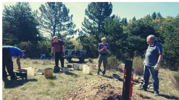
Le chantier de positionnement