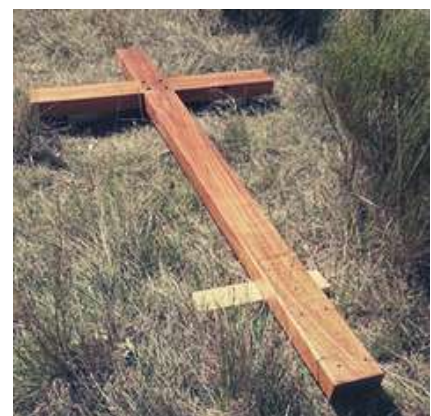
La nouvelle avant la pose